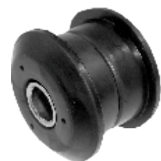
BUCHA BIPARTIDA DA BARRA ESTAB. DIANT. TRAS. MB OF.1620/ OF.1721 Nº ORIG. 3843207050