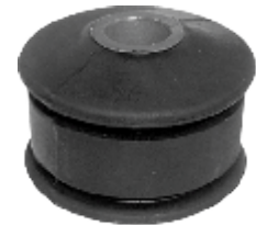
BUCHA PONTA ESTABILIZADOR DIANT. MB 1618 / 1620