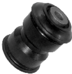
BUCHA MOLA TRAS. P/ DIANT. SPRINTER Nº ORIG. A901.324.02.50