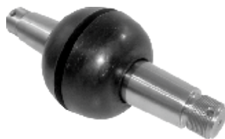
PINO DUPLO SUP. VÉRTICE MODERNO MONOBL. O. 364/365 E 352/355 NºO. 20.030