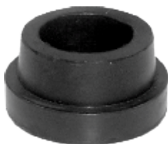
BUCHA ESTAB. DIANT. E TRAS. MB 608 (SINTÉTICA)