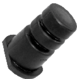
BATENTE MOLA DIANT. ÔNIBUS 1318 / 1618 / 1620