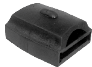
PROTECTOR PONTA MOLA SPRINTER Nº ORG. A901.3250.744