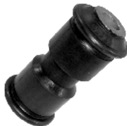
BUCHA JUMELO MOLA TRAS. P/ TRAS. SPRINTER Nº ORIG. 901.324.01.50