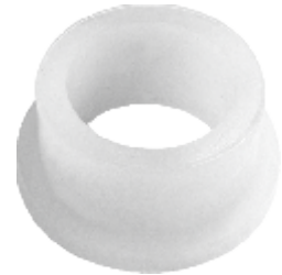
BUCHA ESTAB. DIANT. 1935/1941 (PEQUENA) (NYLON)