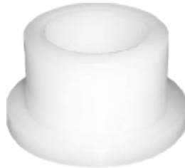
BUCHA ESTAB. DIANT. 1935/1941 (MÉDIA) (NYLON) Nº ORIG. 620.323.0250