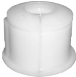
BUCHA BARRA ESTAB. DIANT. 1935/1941 (GRANDE) (NYLON)